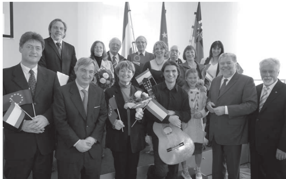
Die Preisträger mit Ministerpräsident Kurt Beck