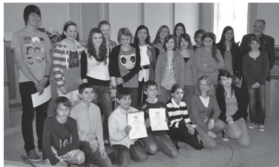
Die Finalteilnehmer nach der Siegerehrung