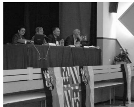
Podium bei der Assemblée Générale

Die erfolgreiche Zusammenarbeit von IFB, Rectorat de Dijon, Partnerschaftsverband und Union, unterstützt vom DFJW, wird auch im nächsten Seminar (Herbst 2010) weitergeführt werden. ■