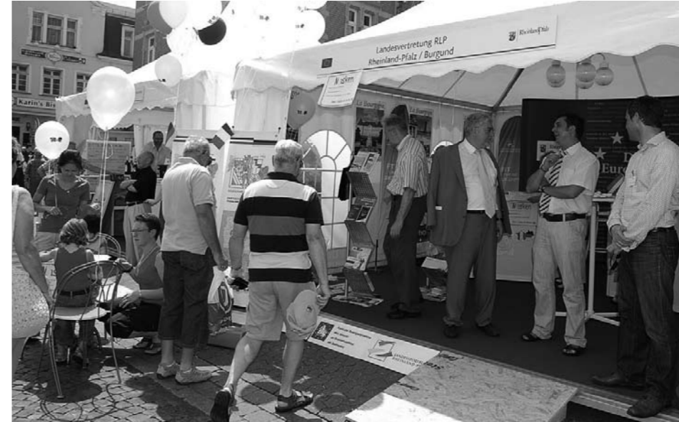
Infostand beim Rheinland-Pfalz-Tag 2009

Vergessen Sie nicht, Ihre Schulen auf die Ausrichtung des Vorlesewettbewerbs für das Schuljahr 2010/2011 aufmerksam zu machen. Unsere Ausschreibung wird Anfang des Schuljahres an alle weiterführenden Schulen in Rheinland-Pfalz versandt; die Schultscheide finden bereits im Herbst statt. ■